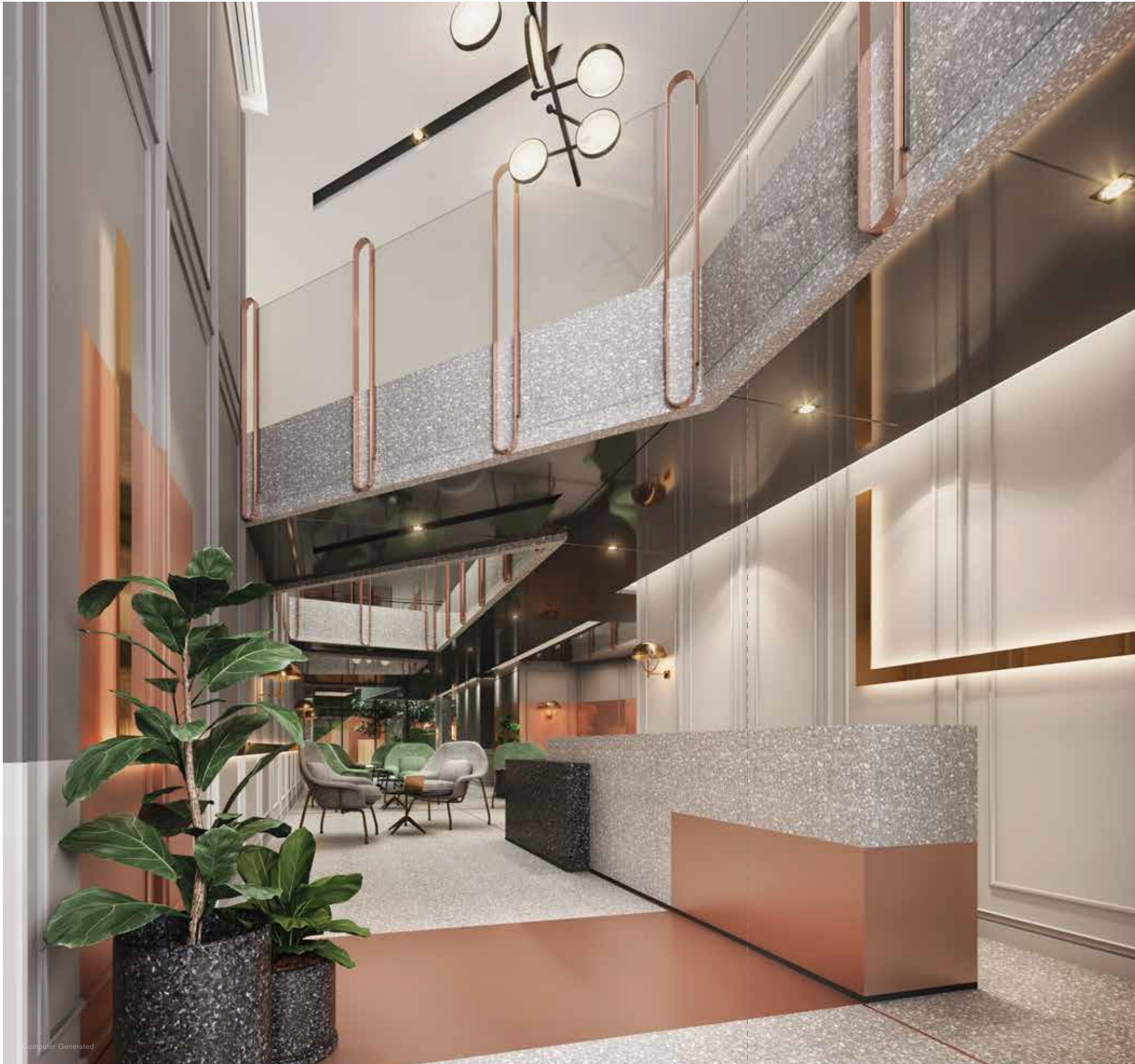
THE CHAPTER HALL