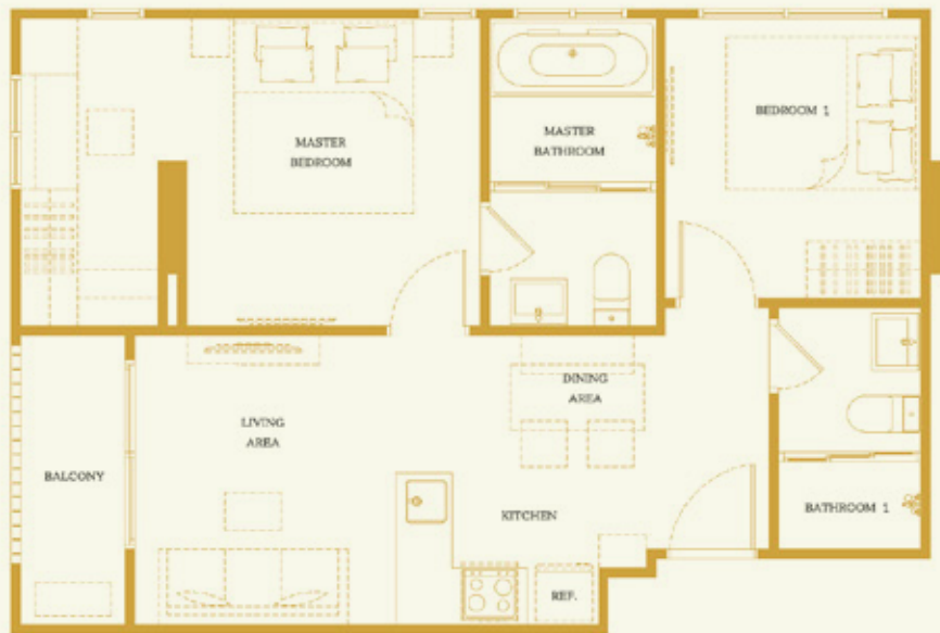
2B 58.25 SQ.M.