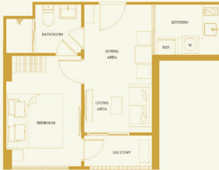
1A 33.50 SQ.M.