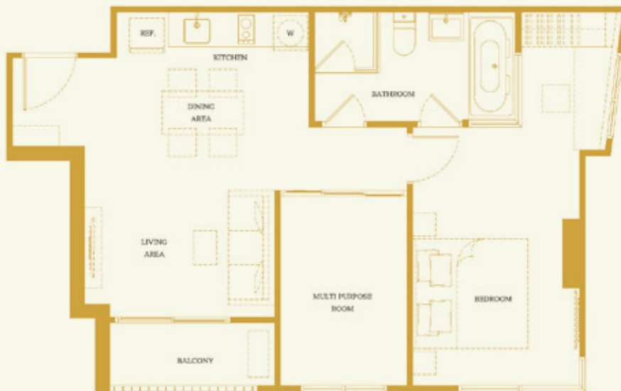
1B 58.25 SQ.M.