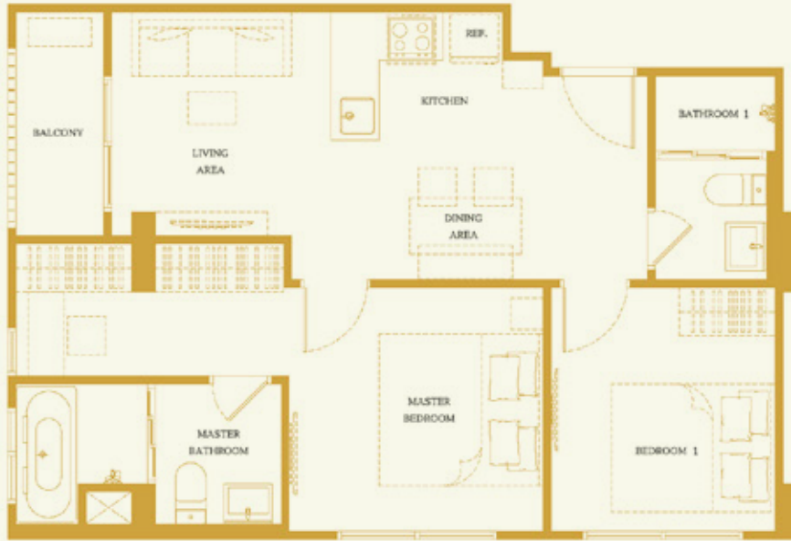
2A 59.00 SQ.M.